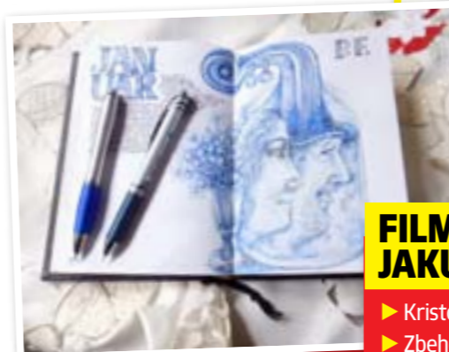
▲ Návrh grafiky pro PF 2023, který se prý »nepáčil«.