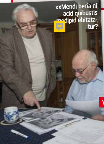
xxMendi beria ni acid quibustis medipid ebitatur?