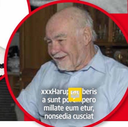
xxxHarup...beris a sunt p...pero millate eum etur, nonsedia cusciat