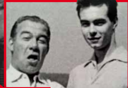
„Děda a táta.“