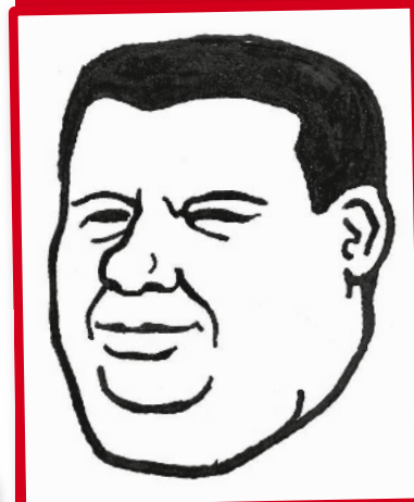
▲ Portrét M. Švandrlíka od kreslíře Jiřího Wintera-Nep Prakty.