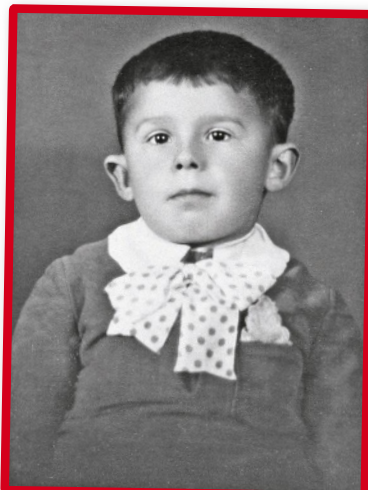
▲ Stejný výraz měl už jako dítě školou povinné.

Jeho otec byl spolužákem Jana Wericha a on sám, ještě dříve, než se stal známým spisovatelem, chtěl být hercem. Učil se hrát na flétnu a určitý čas působil jako vychovatel korejských sirotek. Potom dělal asistenta režie slavnému Alfrédu Radokovi a podobně jako Miroslav Horníček byl jedním z prvních autorů písňových textů pro tehdy ještě neznámého začínajícího skladatele Jiřího Šlitra. Nakonec se přece jen objevil i na jevišti, ve společnosti pánů Šimka a Grossmanna, později Šimka a Soboty, v divadle Semafor. Psal povídky, humoristické romány i aforismy, v roli »náměťáře« vystřídal po boku Jiřího Wintera-Nep Prakty legendárního Bedřicha Kopečného a posléze se stal spoluautorem stovek kreslených vtipů. Z mnoha jeho knih se nejvíc proslavila ta, podle níž byl později natočen i neméně populární stejnojmenný film – Černí