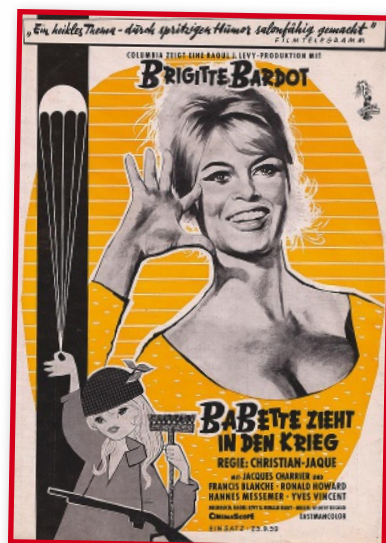
△ Nádherná herečka zářila z filmových plakátů.

Budeme-li počítat i filmy, v nichž se objevila na plátně třeba jen pár desítek vteřin, splela se Brigitte nakonec o dva filmy – její filmografie čítá 48 titulů. Dva roky poté, co prohlašovala, že film je její život, stála před filmovou kamerou naposled... Brigitte Bardot, podle údajů francouzského statistického úřadu přinášející v době své největší slávy do státní pokladny více než celá firma Renault, hvězda známá svými milostnými avantýrami, pokusem o sebevraždu, rivalstvím s některými kolegyněmi, žije dnes – už počtvrté vdána – jen vlastním zájmem o zvířata. Vystupuje všude na jejich