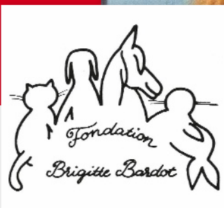
◀ Logo hereččiny nadace.

Mám před sebou texty dvou dopisů, tentokrát už vážně míněných. Napsala je kdysi sama Brigitte a z Francie mířily do Čech. První psala v do-