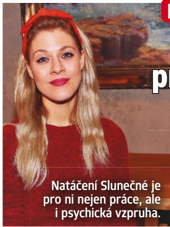
Natáčení Slunečné je pro ni nejen práce, ale i psychická vzpruha.