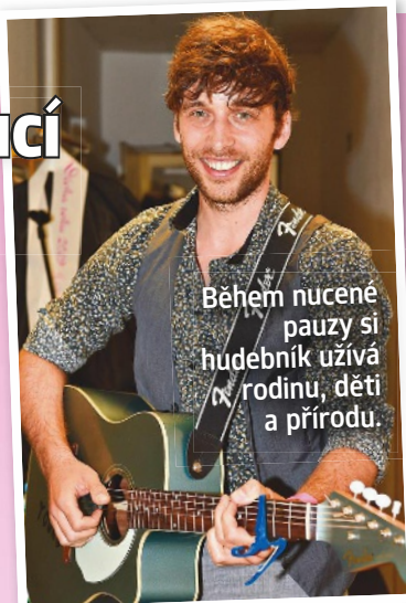
Během nucené pauzy si hudebník užívá rodinu, děti a přírodu.