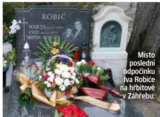
Místo posledního odpočinku Iva Robiće na hřbitově v Záhřebu.