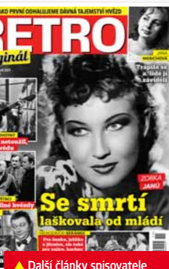
▲ Další články spisovatele Ondřeje Suchého si můžete přečíst v měsíčníku Retro , který právě vyšel.