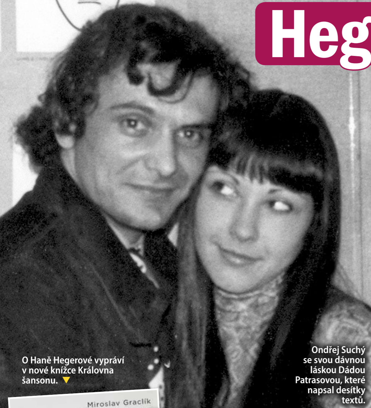
O Haně Hegerové vypráví v nové knížce Královna šansonu. ▼