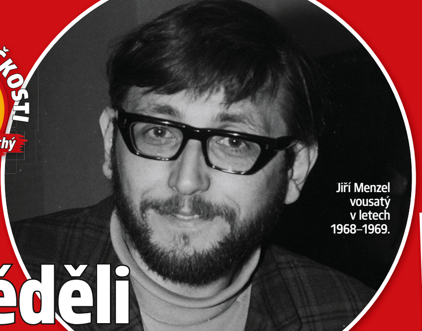
Jiří Menzel vouseč v letech 1968–1969.

2 Mám před sebou barrandovskou smlouvu na jméno Jiřího Menzela. Koupil jsem ji