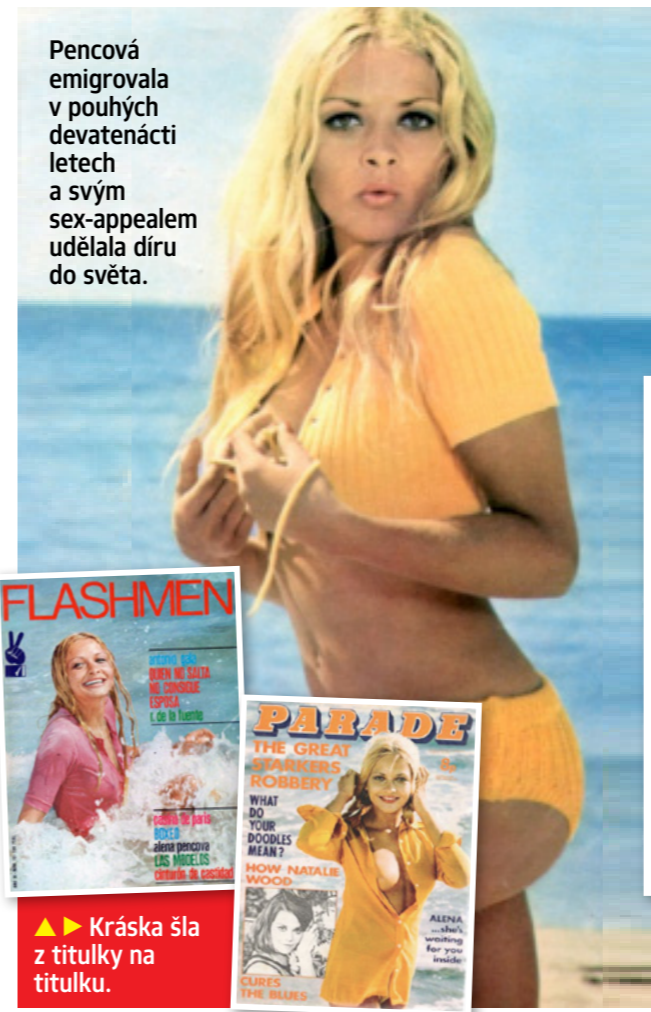
Pencová emigrovala v pouhých devatenácti letech a svým sex-appealem udělala díru do světa.