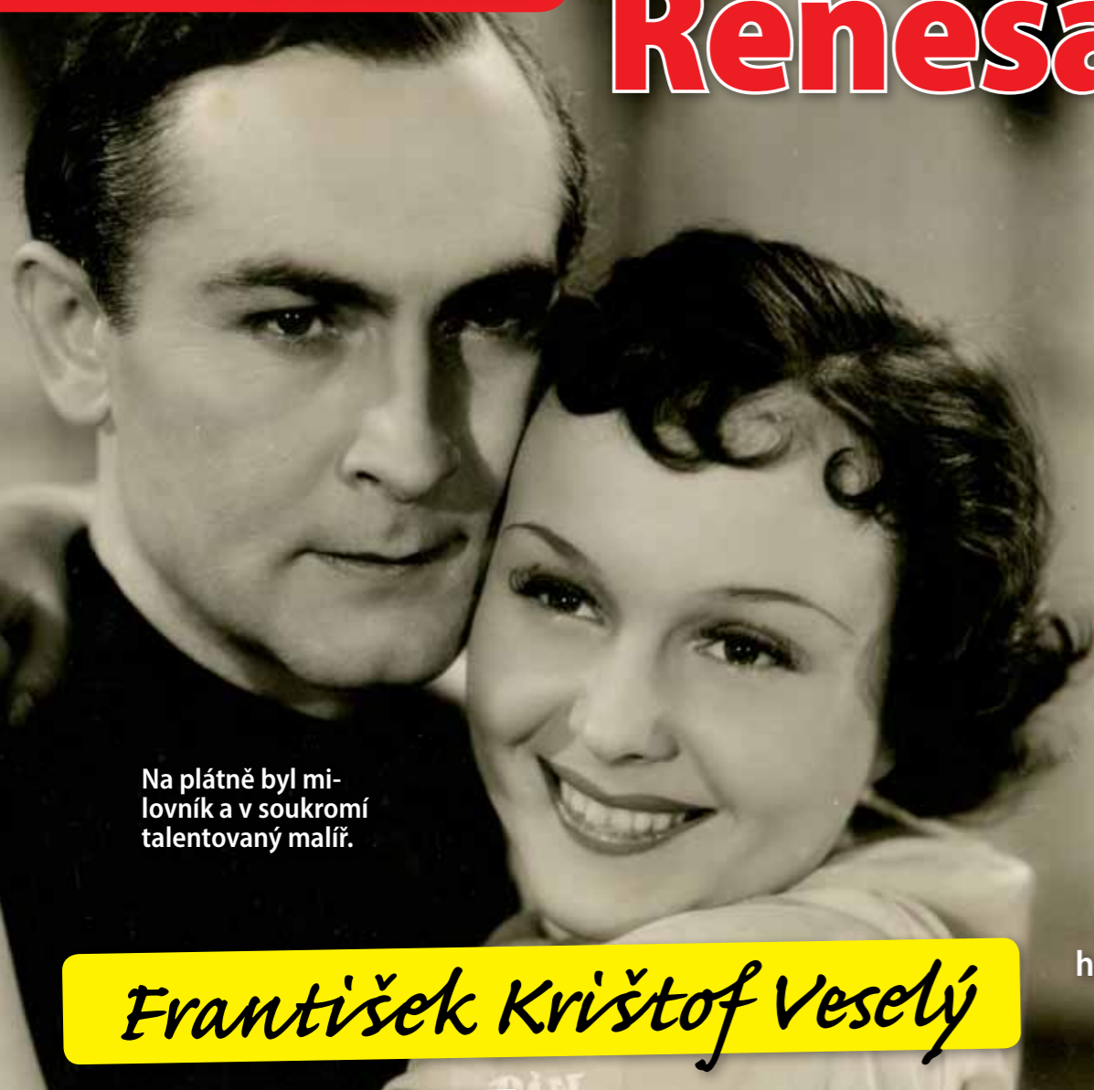
Na plátně byl milovník a v soukromí talentovaný malíř.