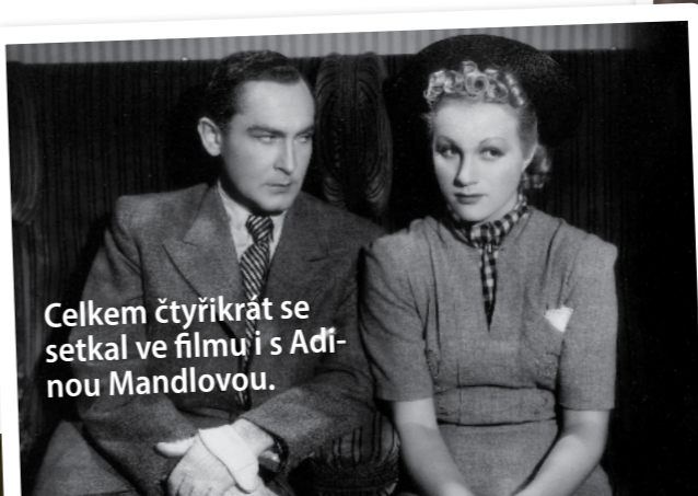
Celkem čtyřikrát se setkal ve filmu i s Adinou Mandlovou.