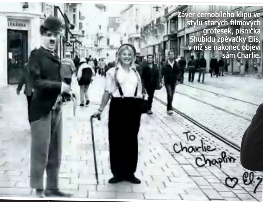
Závěr černobílého klipu ve stylu starých filmových grotesek, písnička Shubidu zpěvačky Elis, v níž se nakonec objeví sám Charlie.

čekané setkání ráda vzpomíná: „Šla jsem o pauze do zákulisního bufetu a tam jsem si všimla pána velice podobného Charliemu Chaplinovi. Stál u stolku sám. Já jsem ho oslovila