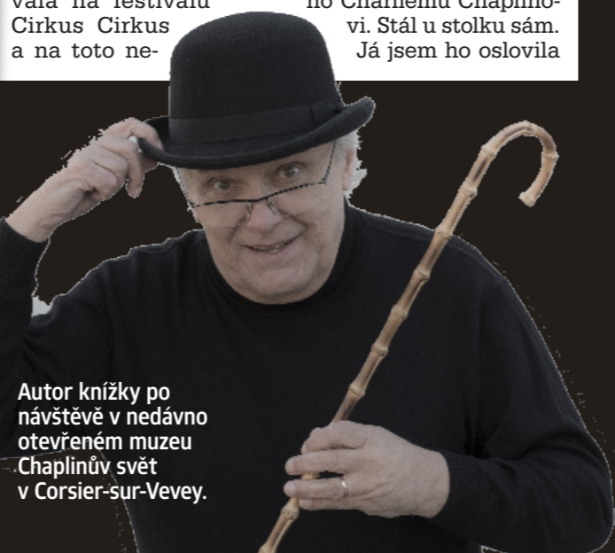
Autor knížky po návštěvě v nedávno otevřeném muzeu Chaplinův svět v Corsier-sur-Vevey.